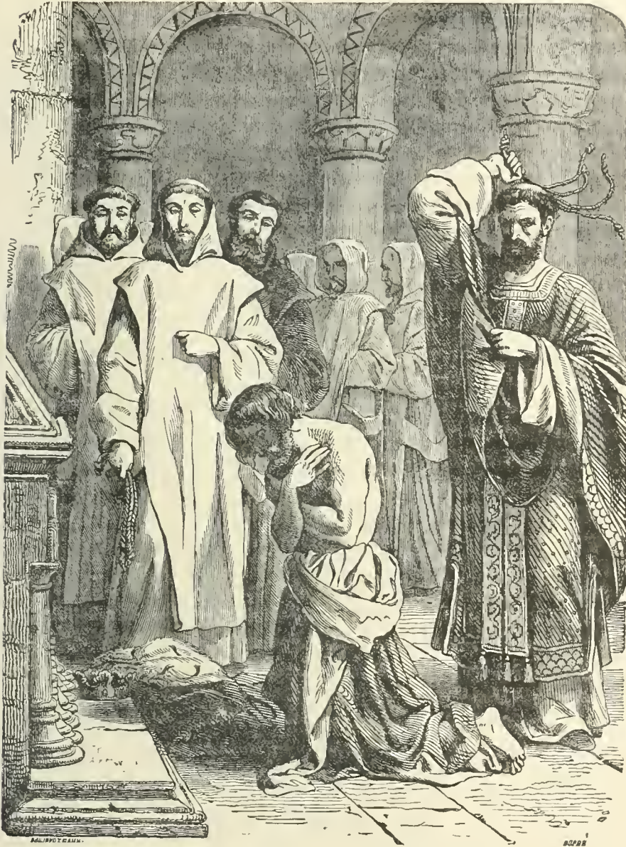
Henri II fait amende honorable au tombeau de Thomas Becket.

évêques irlandais lui remit des lettres signées et scellées en forme de carte authentique, par lesquelles tous déclaraient avoir constitué, de leur propre mouvement, « roi et seigneur de l'Irlande, le